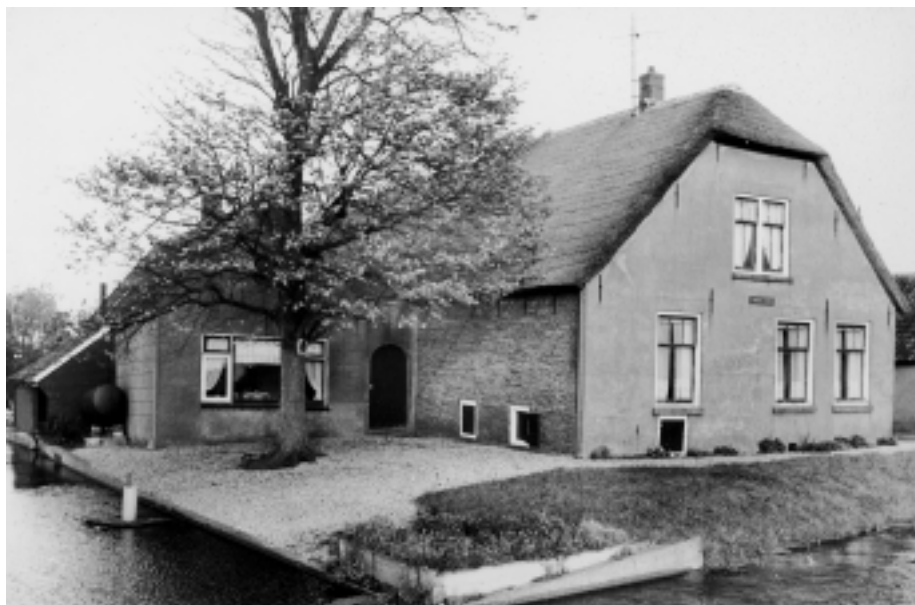
Afb. 12: 'Cornelis-Hoeve', Ridderbuurt nr. 83.