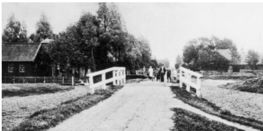
Afb. 6: De draaibrug in de Ridderbuurt over de Vaarsloot, richting Oude Rijn. Dit is een vaste brug, maar omdat de schepen hier moesten 'draaien', kreeg de brug die naam. Rechts ligt de boerderij 'Spruijtenhoeve', Ridderbuurt nr. 6.