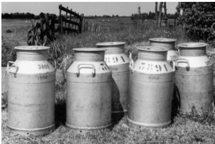
Afb. 10: Toen waren melkbussen nog heel gewoon.